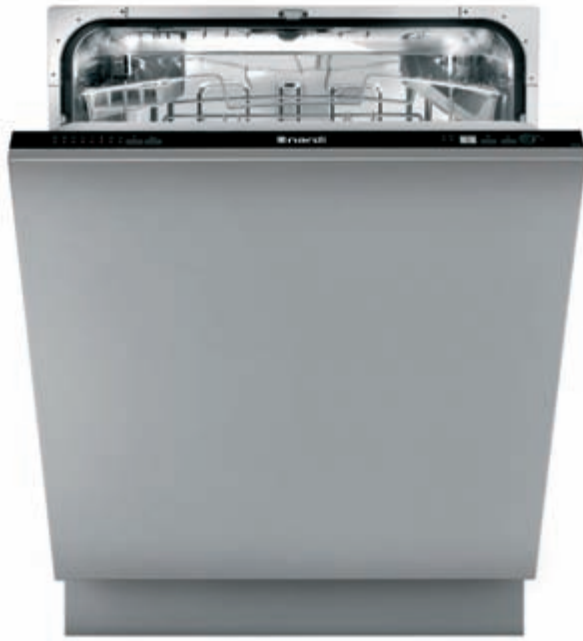
LSI 60 14 HL

Lavastoviglie integrata a scomparsa totale - Sistema di controllo digitale - Energy Label [consumo, lavaggio, asciugatura] A A A - Rumorosità 38 dB(A) pressione sonora - Asciugatura statica - Capacità 14 coperti I.E.C. - 8 programmi di lavaggio - Opzione 3 in 1 - 6 temperature di lavaggio, 40-45-50-55-65-70°C - Funzione mezzo carico - Delay timer - Cesto superiore regolabile - Display digitale - Acquastop sistema integrato antiallagamento - Piedini posteriori regolabili frontalmente - Porta piatta in acciaio KIT LSI PX optional - Schema di incasso E 1