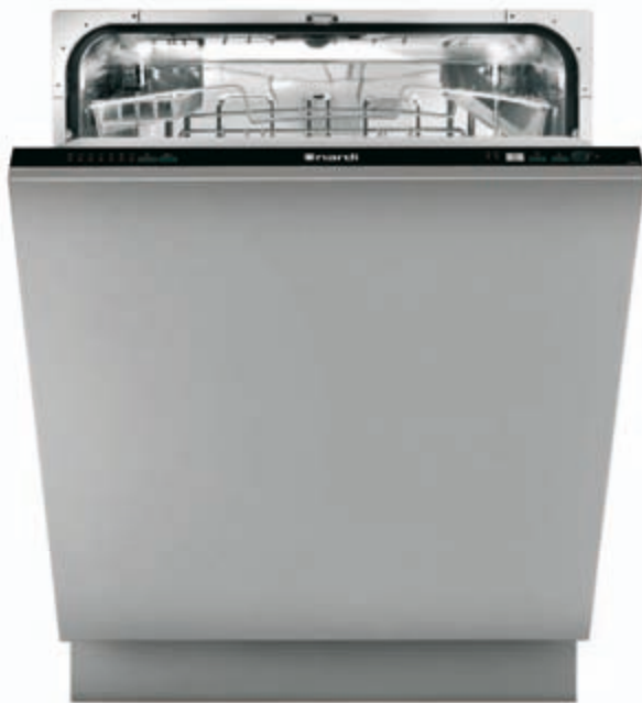
LSI 60 12 HL

Lavastoviglie integrata a scomparsa totale - Sistema di controllo digitale - Energy Label [consumo, lavaggio, asciugatura] AAA - Rumorosità 38 dB(A) pressione sonora - Asciugatura dinamica - Capacità 12 coperti I.E.C. - 7 programmi di lavaggio - Opzione 3 in 1 - 6 temperature di lavaggio, 40-45-50-55-65-70°C - Funzione mezzo carico - Delay timer - Display digitale - Cesti ad organizzazione flessibile - Acquastop-sistema integrato antiallagamento - Piedini posteriori regolabili frontalmente - Porta piatta in acciaio KIT LSI PX optional - Schema di incasso E 1