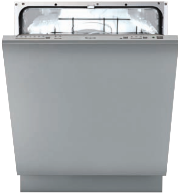
LSI 60 HL

Lavastoviglie integrata a scomparsa totale - Sistema di controllo digitale - Energy Label [consumo, lavaggio, asciugatura] A A A - Rumorosità 37 dB(A) pressione sonora - Asciugatura statica - Capacità 12 coperti I.E.C. - 7 programmi di lavaggio - 6 temperature di lavaggio, 40-50-55-60-65-70°C - Funzione mezzo carico - Delay timer - Cesti ad organizzazione flessibile - Spie riserva sale e brillantante - Sistema integrato antiallagamento - Piedini posteriori regolabili frontalmente - Porta piatta in acciaio KIT LSI PX optional - Schema di incasso E 1