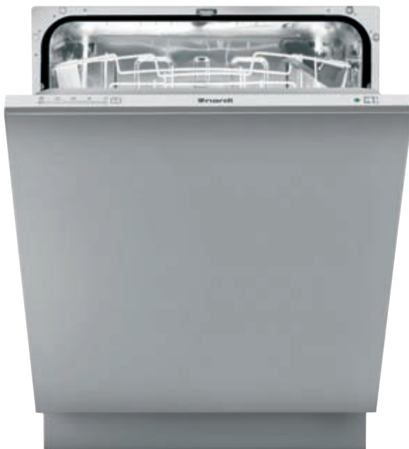
LSI 60 12 SH

Lavastoviglie integrata a scomparsa totale - Sistema di controllo digitale - Energy Label [consumo, lavaggio, asciugatura] A A A - Rumorosità 40 dB(A) pressione sonora - Asciugatura statica Capacità 12 coperti I.E.C. - 5 programmi di lavaggio - 4 temperature di lavaggio, 40-50-55-70°C - Cesto superiore regolabile - Piedini posteriori regolabili frontalmente - Aquastop sistema integrato antiallagamento - Porta piatta in acciaio KIT LSI PX optional - Schema di incasso E 1