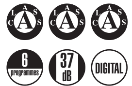
LSI 45 HL

Fully integrated dishwasher, 45 cm - Electronic control - Energy Label [energy efficiency, washing, drying] A A A - Noise level 37 dB(A) acoustic pressure - Condensation drying - 9 place settings I.E.C. - 6 programmes - 5 wash temperatures, 40-48-55-60-70°C - Half load function - Delay timer - Aquastop flood protection - Built-in plan E 2